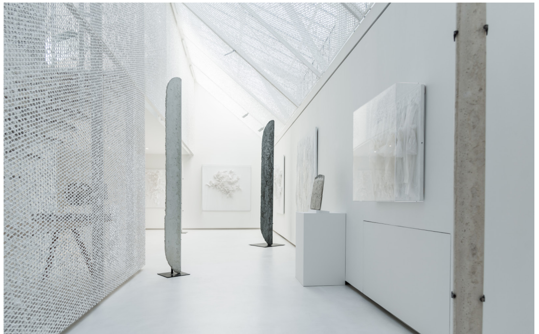
Clavé Fine Art.

Clavé Fine Art est une galerie d'art moderne et contemporain, offrant un espace d'exposition unique au cœur de la rive gauche parisienne. Établie dans l'ancien atelier de César redessiné par l'architecte japonais Kengo Kuma, Clavé Fine Art a ouvert ses portes en 2021 à Paris. Invisible de l'extérieur, l'intérieur de la galerie surprend par son volume et la lumière qui émane de ses murs et son plafond en « washi », technique japonaise de papier mâché. L'espace offre un cadre intime, où Clavé Fine Art privilégie des expositions où dialoguent les œuvres et le lieu. La galerie s'emploie à proposer un programme d'expositions autour d'artistes reconnus et établis, tout en s'efforçant de présenter des œuvres inédites sur le marché. Clavé Fine Art aspire également à travailler aux côtés d'artistes émergents dans le but de promouvoir les jeunes talents de demain.