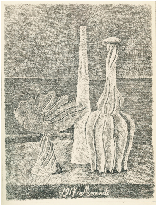
Natura morta con compostiera, bottiglia lunga e bottiglia scannellata, 1928. Gravure sur toile, 23,5 x 18,2 cm. Collection privée, Italie

Du 18 octobre au 17 décembre 2022, Clavé Fine Art, en collaboration avec Maggiore g.a.m., présente une rétrospective consacrée à Giorgio Morandi, artiste italien majeur du XX e siècle, dans l'espace intime et lumineux de l'ancien atelier de César restauré par l'architecte Kengo Kuma. L'exposition « Portrait intime » revient sur l'ensemble de la carrière de l'artiste et présente plus d'une vingtaine de pièces datées de 1913 à 1963, soit un an avant son décès. Les œuvres exposées témoignent de l'art de Morandi, qui décline l'abstraction à travers ses célèbres natures mortes mais aussi des paysages et bouquets de fleurs, représentés avec une variété de techniques : huiles sur toiles, gravures, dessins et aquarelles.