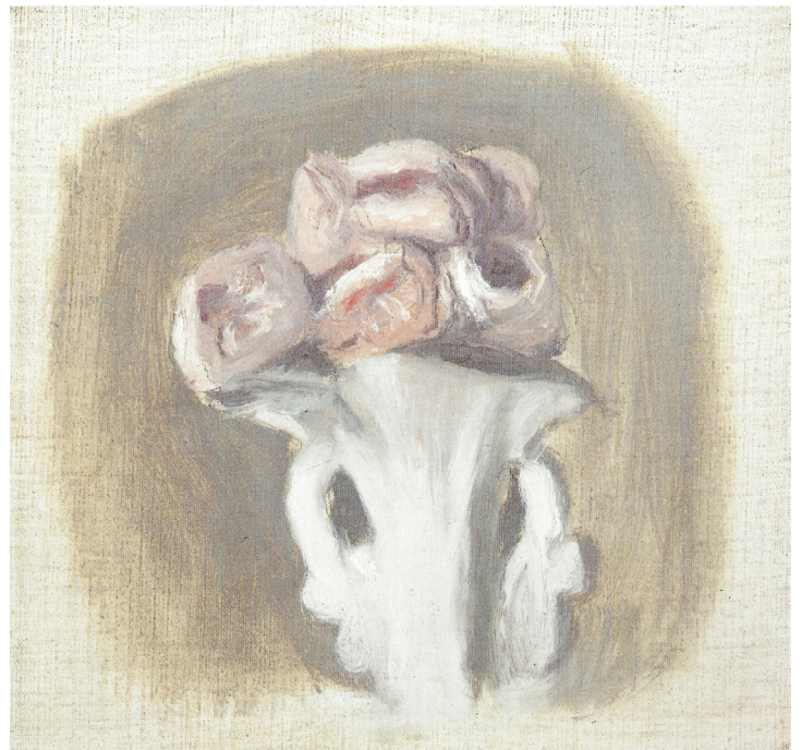
Fiori, 1947. Huile sur toile, 22,8 x 23,5 cm. Collection privée, Italie

L'exposition hommage « Portrait Intime » souhaite remettre l'art de Morandi, artiste italien occupant une place à part dans l'histoire de l'art, sur le devant de la scène culturelle parisienne, la dernière exposition personnelle en institution consacrée à l'artiste s'étant tenue il y a plus de vingt ans au Musée d'Art Moderne de Paris.